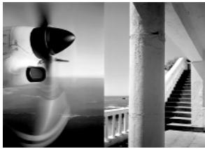
Le bleu du ciel "Dyptique : avion et colonnade"