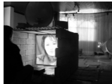
Espace arts plastiques de Vénissieux Slimane Rais, "A quoi rêve la méduse ?"