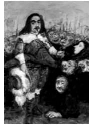
Galerie Gérard Chomarar ENS lettres et sciences humaines Patrick Bachs, "Les anges sont arrivés demain"