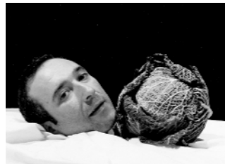
Galerie Domi Nostrae Saverio Lucariello, "Vanitas au chou"