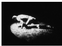
Centre d'arts plastiques de Saint-Fons Aiyoung Yun, "Trace", 1999