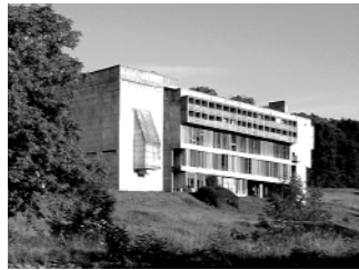
Centre culturel de la Tourette Vue NO du couvent