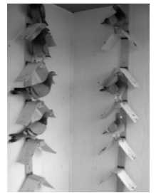
La BF15 Yann Toma, "BF 15 airport", 2003

L'attrape-couleurs 5 place Henri Barbusse - 69009 Lyon Ouvert du mardi au samedi de 13h à 19h (entrée libre) Infos : 04 72 19 73 86 - www.attrape-couleurs.com