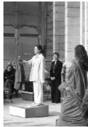
Compagnie Française Coupat Théâtre de la Chrysalide "La foire 2040 à Lyon"