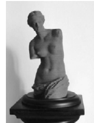
Bibliothèque municipale de Lyon Gérard Collin-Thiébaud "Vénus de Milo", transcription 1998