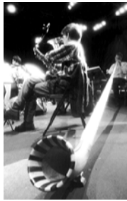
Grame Ensemble Orchestral Contemporain