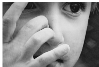
Villa Gillet